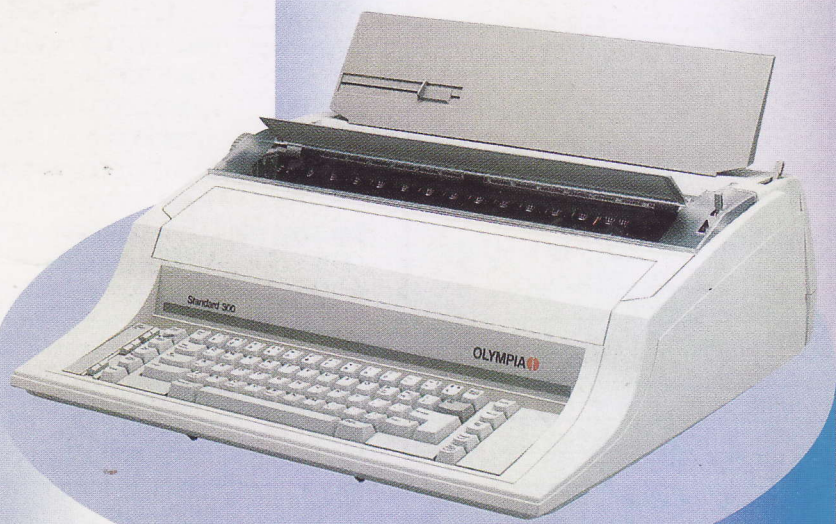
S TANDARD 300